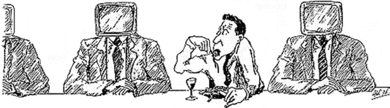
Zukunftsvision aus der Technik und Leben Selbstdarstellung 1986